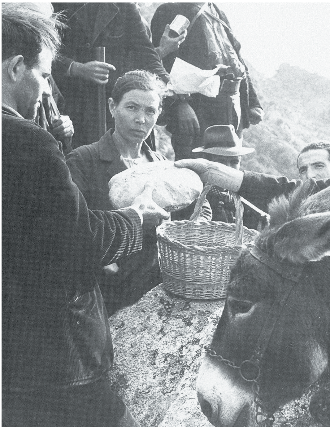
▲ © Cliché NARA - Ravitaillement d'un groupe de résistants.